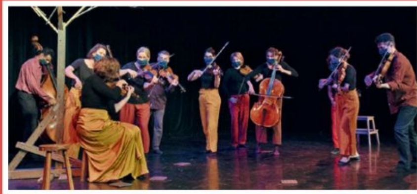
Spectacle Les Saisons - Dodéka pour le climat.